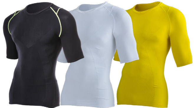
“SMART WARRIORS” 第一弾 『ENERGY WEAR (エネルギーウェア)』