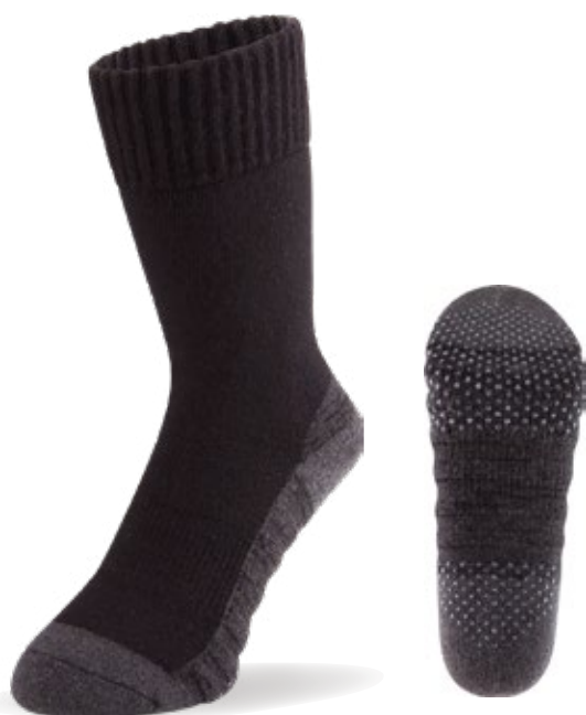
足裏に滑り止め付き